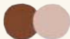
RU 61770 Кремовый латте Creamy Latte