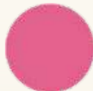
RU 61951 Камелия Camellia