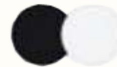
RU 61772 Птичье молоко Ptichye moloko