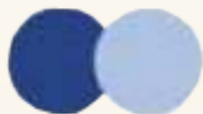
RU 61771 Голубика Blueberry