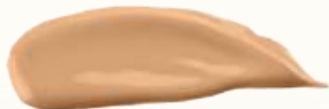
RU 62156 Ivory Слоновая кость