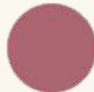
RU 61953 Пион Peony