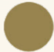
RU 61751 Античное золото Antique gold