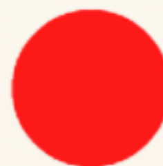
RU 21506 Мерилин