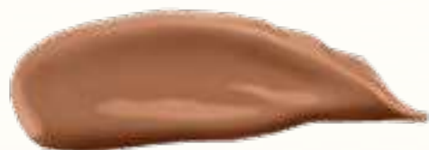
RU 62155 Beige Praline Бежевое пралине