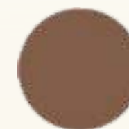
RU 61800 Молочный шоколад Milk chocolate