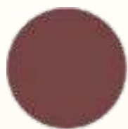
RU 61850 Трюфель Truffle