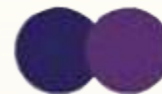
RU 61769 Черничное мороженое