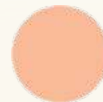
RU 62101 Персиковый джем Peach jam