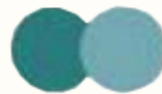
RU 61773 Мятное мороженое Mint ice-cream