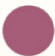
RU 61854 Цвет ваших губ Color of your lips