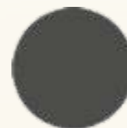
RU 61801 Горький шоколад Dark chocolate