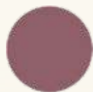
RU 61950 Карамель Caramel

Не бойтесь сочетать разные оттенки и текстуры помад и блесков. А прекрасные ароматы ванили, вишни, сладкого апельсина и кокоса создадут самое чудесное настроение на весь день!