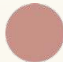
RU 62102 Розовый мускус Rosy Musk